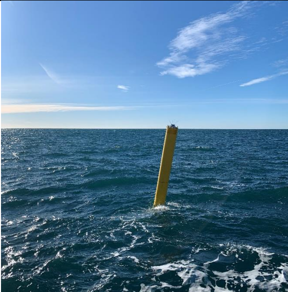
Utsatt sjömärke i projektområde Vidar.